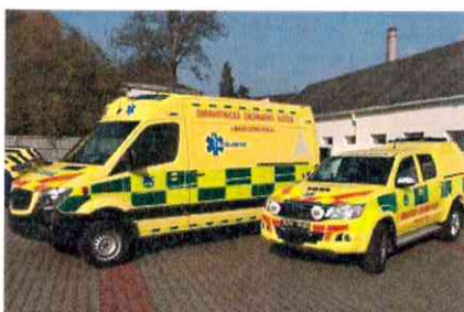
Nové záchranné vozy